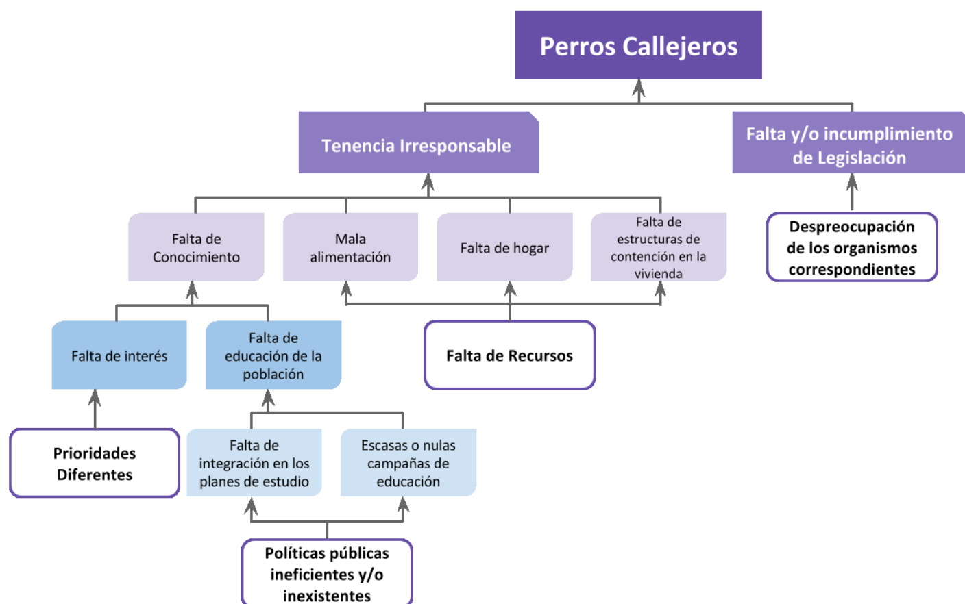
Fig. 2: Árbol de Problemas.